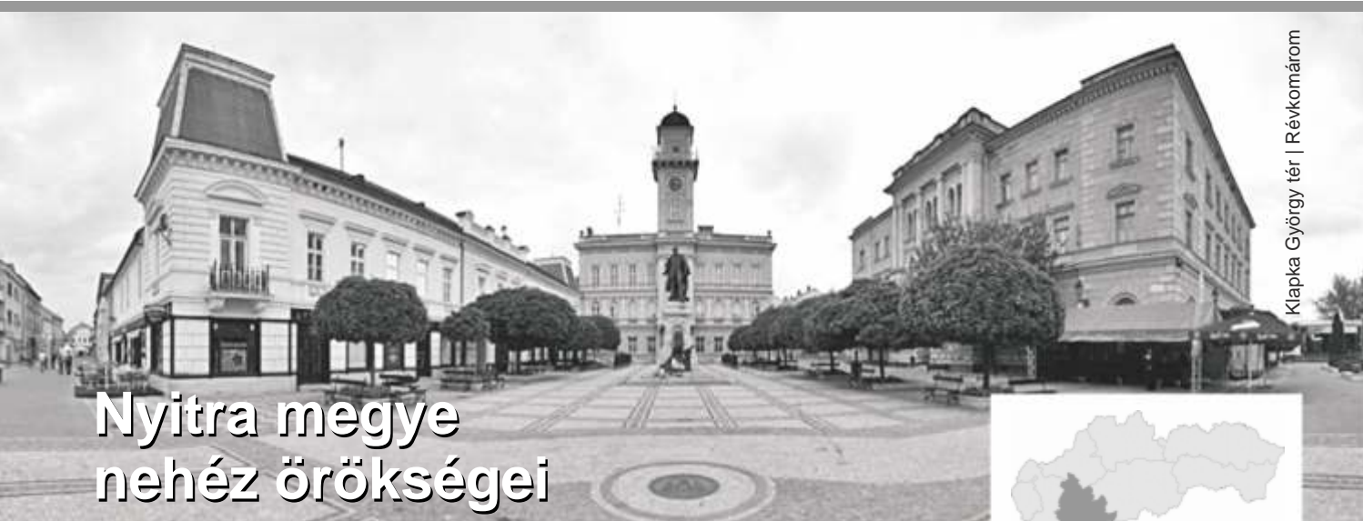
Klapka György tér | Révkomárom