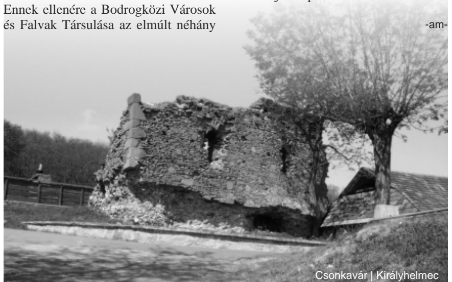
Csonkavár | Királyhelmecc