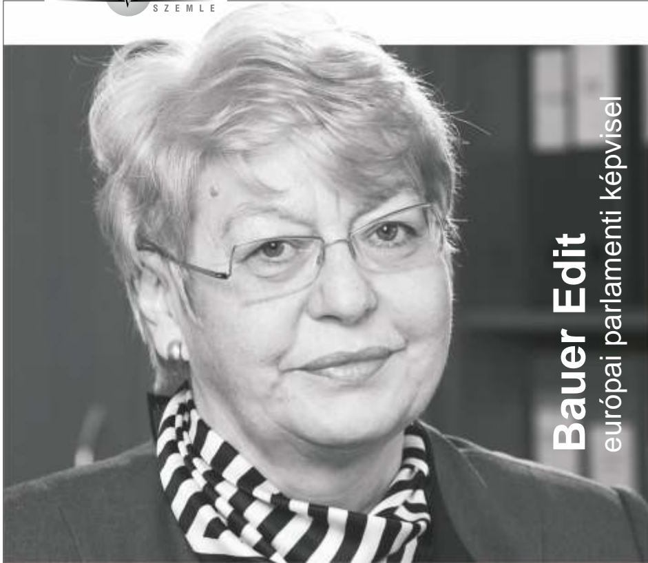
Bauer Edit európai parlamenti képviselő