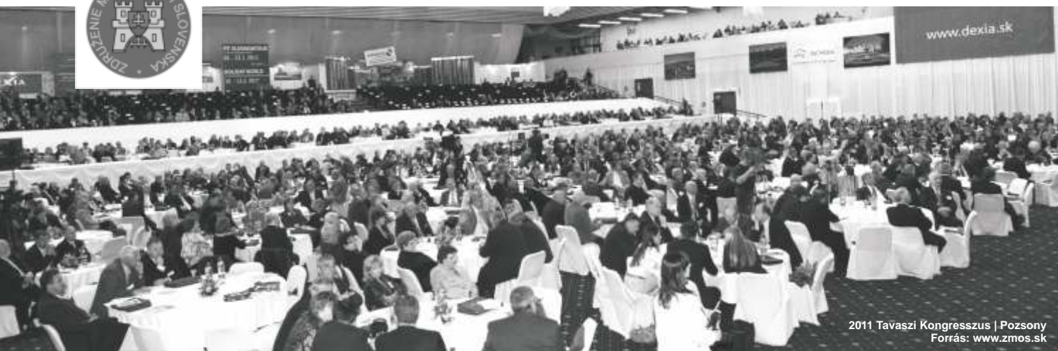
2011 Tavaszi Kongresszus | Pozsony

mutatkoznak. A Szlovákiai Városok és Falvak Szövetsége ezért gyakorol er teljes nyomást a kormányra, hogy a 2014-2020-as programozási id szak el készítése, a feltételek megvitatása során vegye figyelembe a városok és falvak ötleteit és javaslatait. k tudják a legjobban, hol szorít a cip , s azt is, melyek azok az adminisztratív akadályok, amelyek megnehezítik a források merítését. Hazai viszonylatban pedig azt kell tudatosítania minden érdekeltnek, hogy a források hatékony felhasználása elképzelhetetlen az önkormányzatok nélkül.