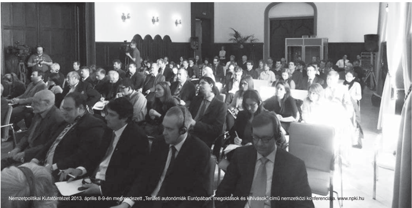
Nemzetpolitikai Kutatóintézet 2013. április 8-9-én megrendezett „Területi autonómiák Európában: megoldások és kihívások” című nemzetközi konferenciája. www.npki.hu