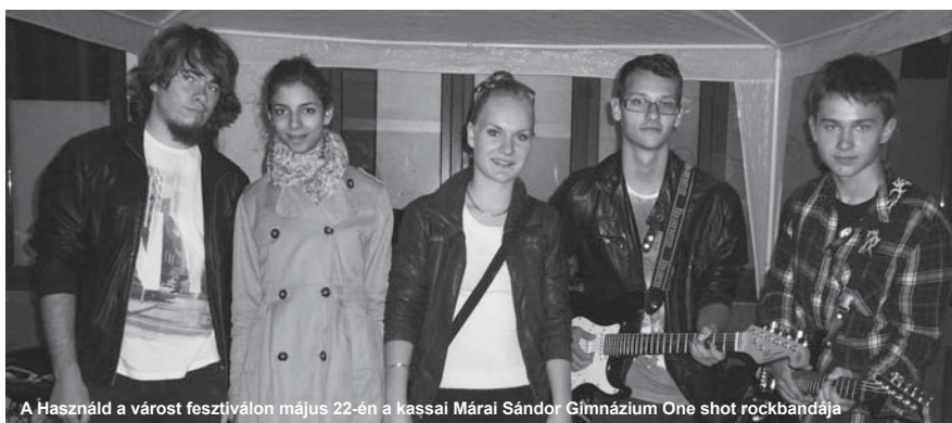
A Használd a várost fesztiválon május 22-én a kassai Márai Sándor Gimnázium One shot rockbandája