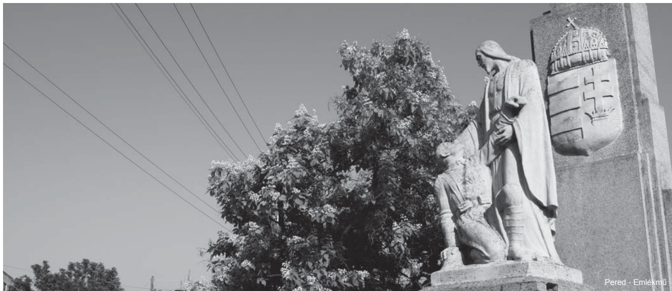
Pered - Emlékmű