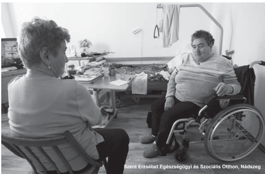
Szent Erzsébet Egészségügyi és Szociális Otthon, Nádszeg

Egy olyan rendszerrel állunk szembe, illetve vagyunk körbehálózva, amelyből a menekülési útvonal mindig a községek felé vezet. Nekem nincs azzal bajom, hogy sok köteleességet kell ellátni, hiszen azt mondják, hogy ahol hét gyermek jóllakik, a nyolcadik sem marad éhen. Csak szemléltetésképpen: egy állami intézményben egy adott ügyet talán tízen intéznek, míg önkormányzati szinten tíz ügyet egy hivatalnok intéz. Természetesen szükség van, pontosabban inkább lenne saját forrásokból létrehozott beruházásokra, fejlesztésekre és fenntartásra is, de az eddigi tapasztalataim azt mutatják, hogy ezen a téren nagyon mostoha helyzetben vagyunk. A községek nem csak most, de korábban is alul voltak és vannak finanszírozva, és saját forrású beruházásokról talán csak álmodni lehet. Egy egyszerű példa: a bérlakások építése, amelyekre nagyon nagy szükség van, az állam és a lakásfejlesztési alap közös projektje már nagyon régen. Az állami támogatás és hitel a községek részére 30 éves futamidővel, 1 százalékos kamattal, az első látásra nagyszerűnek tűnhet, de az a bizonyos 1 százalék is nagyon sok tud lenni, a 30 évről nem is szólva. A 30