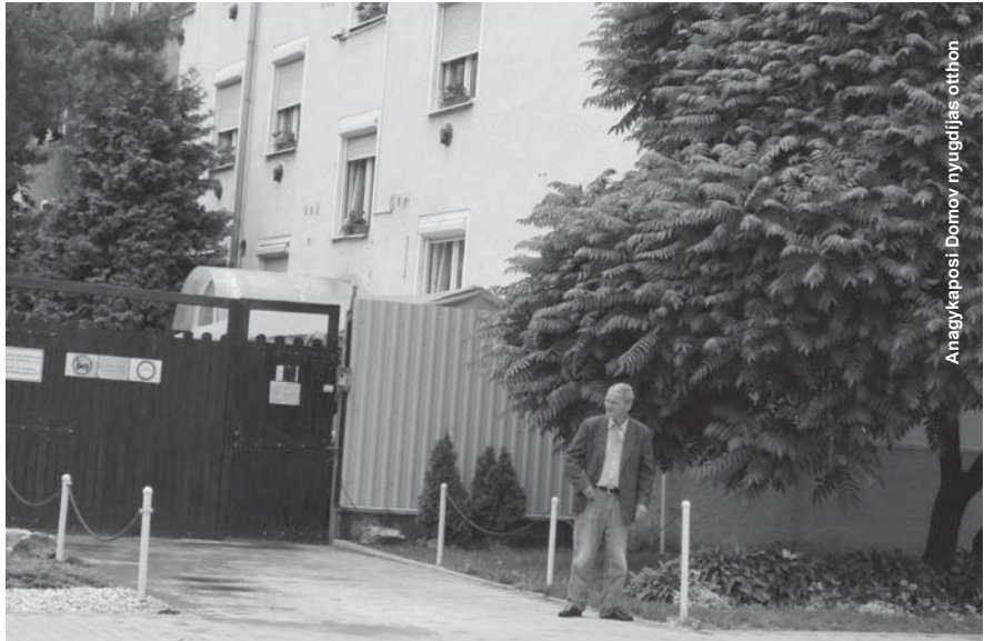
A nagykaposi domov nyugdíjas otthon