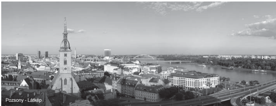
Pozsony - Látkép