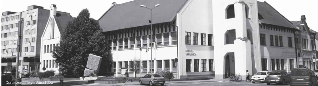
Dunaszerdahely - Városháza