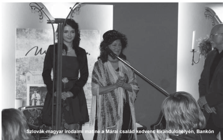
Szlovák-magyar irodalmi márné a Márai család kedvenc kirándulóhelyén, Bankón

A Magyar Zsidó Kulturális Egyesület képviseli Budapestet és Magyarországot Kassán a Mazal Tov Zsidó Kulturális Fesztiválon. A főkonzulátus szervezésében a veszprémi Mendelssohn kamarazenekar a Művészetek Házában, a Tzomet zenekar az evangélikus