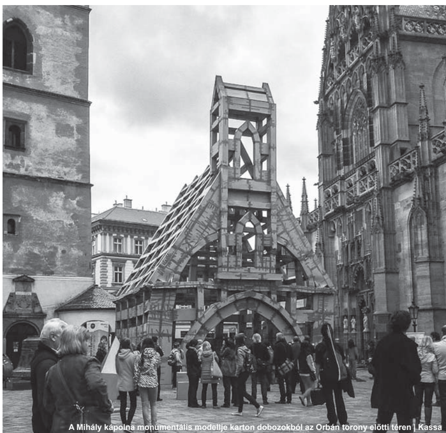
A Mihály kápolna monumentális modellje karton dobozokból az Orban torony előtti téren | Kassa

Egy különleges kiállítás megnyitására is sor kerül a Kelet-szlovákiai Múzeumban. A bemutató a „Párhuzamos történetek Budapest és Kassa, főváros és régiócentrum a 19. század második felében” címet viseli, és párhuzamba állítja a két város, Buda-Pest és Kassa 19. század második felében bekövetkezett urbanisztikai és építészeti fejlődését. A kiállítást a Budapesti Történelmi Múzeum készíti, s különböző festményeket, metszeteket, építészeti terveket, korabeli fényképeket tár az érdeklődők elé. A tárlatnak a felújítás alatt álló, a tavaly fennállásának 140. évfordulóját ünnepe-