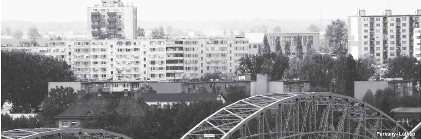
Párkány - Látkép

Viszonylag újnak mondható az az általános érvényű városi rendelet, amely a kultúra és a sport téren nyújtott támogatásokra vonatkozik. A 3/103-as számú rendelet alapján az a párkányi lakos, aki valamilyen kulturális- vagy sportrendezvényt szervez, netán a várossal kapcsolatos kiadványt tervez megjelentetni, esetleg valamilyen helytörténeti megemlékezést készül össze-