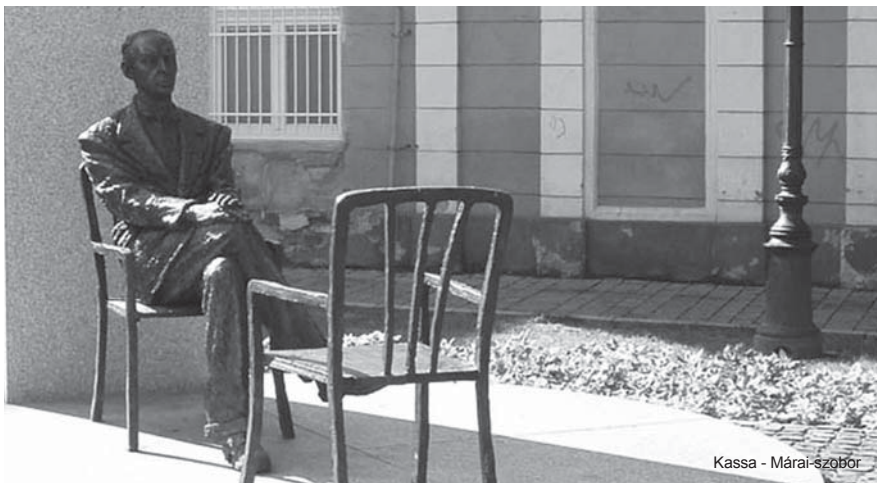
Kassa - Márai-szobor