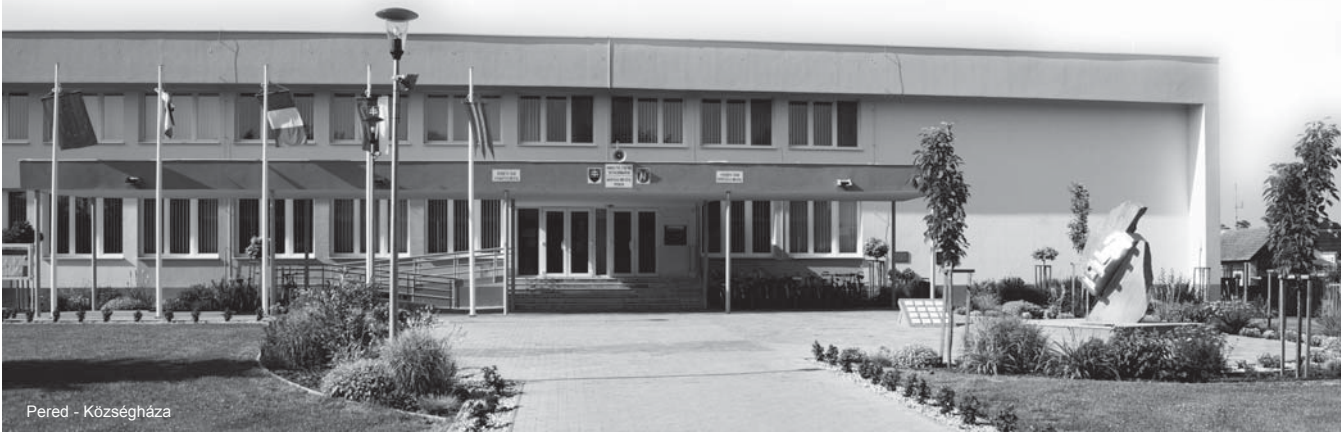
Pered - Községháza

A Szlovákiai Városok és Falvak Társulása közgyűlésének egyik legvitatottabb témája a szociális ellátórendszer működése-működtetése volt. A témakörrel kapcsolatos kérdéseimre polgármesterek, hivatalvezetők és felelős községi alkalmazottak válaszoltak, akik valamennyien egyetértettek abban, hogy a szociális gondoskodás, a gondozószolgálat, a gyermekétkeztetés, a közmunka-programok, a szociális otthonok fenntartása és más, az idősekről, gyerekekről, elesettekről és nélkülözőkről való gondoskodást hatékonyan helyi szinten lehet és kell biztosítani. Mindez azonban csak az állam és a helyi önkormányzat szerepének tisztázásával, a jogok és hatáskörök pontos meghatározásával, az erre szánt anyagiak áttekinthetőségével és hosszútávú garantálásával lehetséges elfogadható színvonalon.