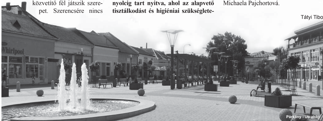
Párkány - Utcakép