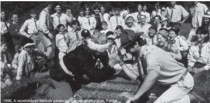
1996. A vezetőképző táborok parancsnokainak vetélkedése, Palást

– Fő célunk, hogy egy önkéntes alapon munkálkodó, testileg, lelkileg és szellemileg egészséges, a keresztény/keresztényen hitét, a magyarságát megismerő, illetve azt gyakorló, csapatban és önállóan is gondolkodó, döntésképes fiatal neveljünk fel a cserkészmódszereken alapuló kiscsoportos korosztályi nevelőprogramnak köszönhetően. A lényeg: heti rendszeres, következetes kiscsoportos nevelőmunka, mely a tudásanyagot túl a vezető példamutatásán keresztül neveli a 10 cserkésztvörvény és a cserkészfogadalom szellemében a fiatalokat. Az összes többi programunk – túrák, kirándulások, megemlékezések, vetélkedők, sportrendezvények, táborok, régiós és országos programjaink – ezt a kiscsoportos nevelőmunkát segítik és egészítik ki. Az a cserkész, aki barátai, cserkészársai körében, azokkal közösen a természetben felveri sátrát, kiépíti annak körletét, táborúzi jelenetet gyakorol be, majd ad elő nyilvánosan, örsével közösen főzi meg a saját vacsoráját, vagy 24 órás túrán belül gyakorolja a térkép szerinti tájékozódást, az észrevétlenül is sok-sok olyan