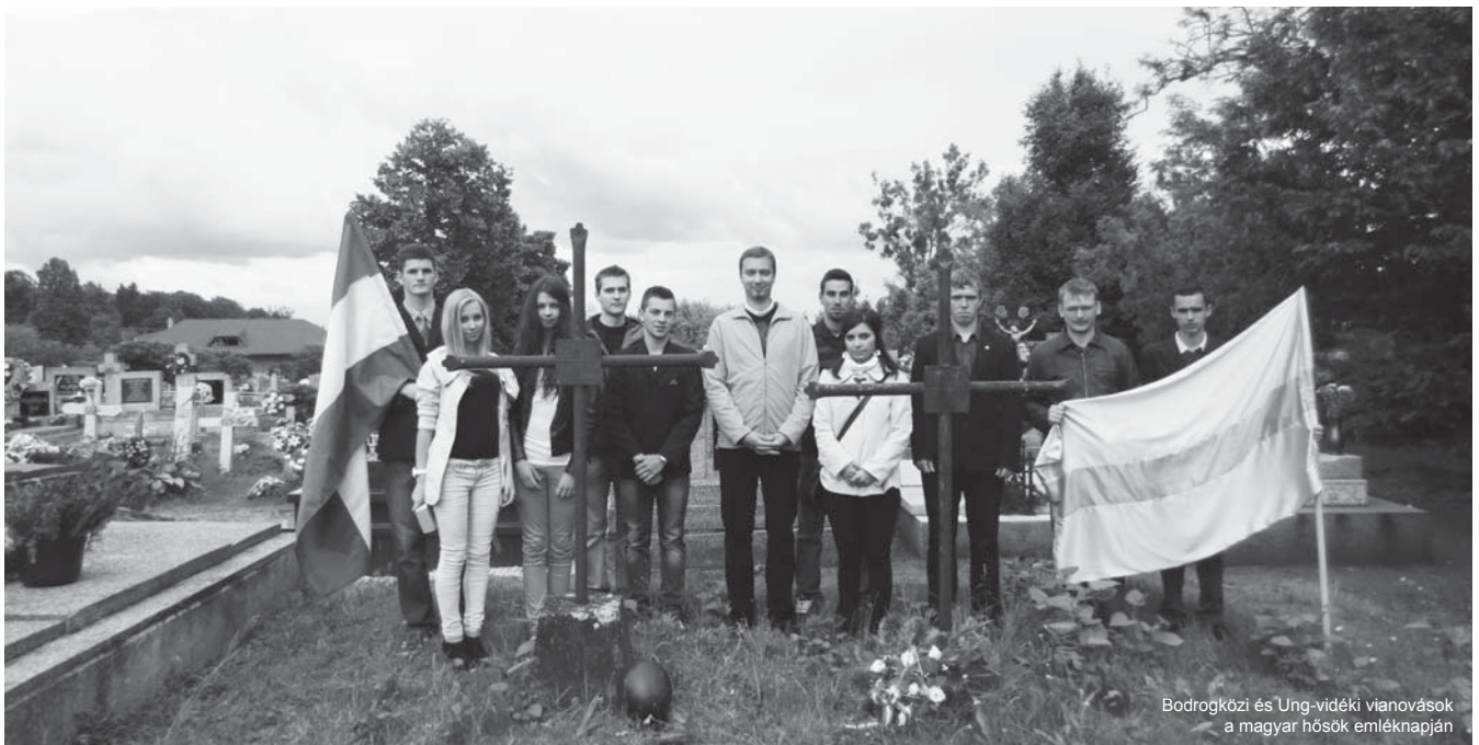
Bodroghközi és Ung-vidéki vianovások a magyar hősök emléknapiján