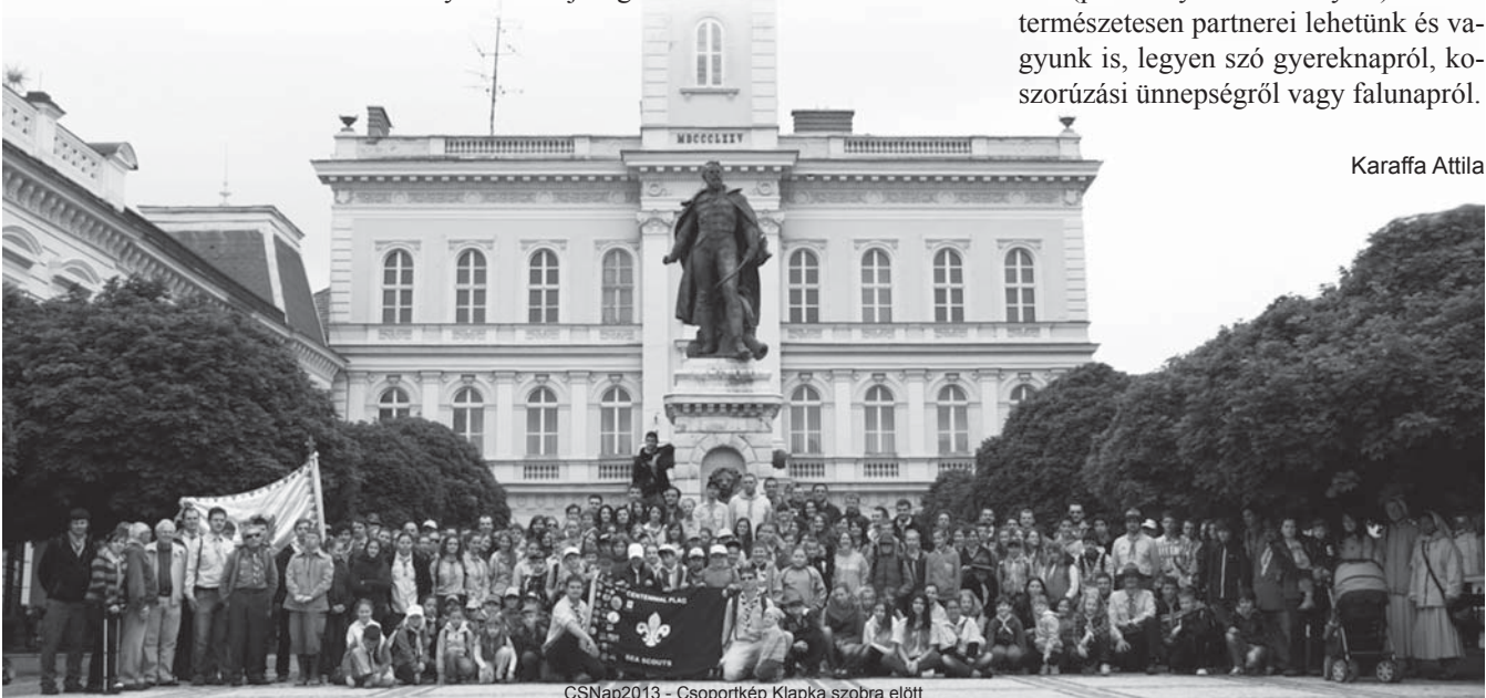
CSNap2013 - Csoportkép Klapka szobra előtt