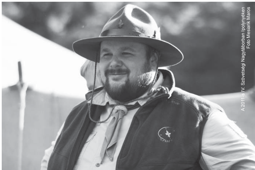
A 2011-es IV. Szövetségi Nagytáborban Ipolynyéken

– Az 1907-es angliai kezdetet követően nagyon gyorsan eljutott a cserkészzet eszméje az akkori Magyarországra. Az alapító, Robert Baden-Powell (cserkésznéven BiPi) kézikönyvének, a Scouting for Boys (Cserkészlet fiúknak) alapkönyvnek több száz oldalas magyar nyelvű kivonata jelent meg Králik László fordításában már az 1909-1910-es Nagybacsókeréki Főgimnázium Értékesítőjében, a mai Vajdaság területén. Budapesten és a nagyobb városokban sorra jelentek meg a cserkészcsapatok. Nagy segítség volt ebben az, hogy az akkori legjelentősebb ifjúsági és diáklap, a Zászlónk szerkesztősége figyelemmel kísérte és segítette ennek az új gyermek és ifjúsági nevelőmozgalomnak a kezdeteit, majd a kibontakozását. A mai Szlovákia területén is legelőször a Zászlónk lapnak köszönhetően figyeltek fel a cserkészletben rejlő nevelési lehetőségekre a révkomáromi bencés gimnáziumban, ahol 1913 tavaszán megindult a cserkészlet megszervezése, majd 1913. május 23-án hivatalosan is megalakult – az országos elnökség jelenlétében – a csapat Karle Sándor paptanár vezetése alatt. A komáromi cserkészek még abban az évben részt vettek a magyar cserkészmozgalom egyik leghíresebb mozgótáborán, az első cserkész vági tutajúton, ahol 105 cserkész 6 tutajon ismerkedett a felvidéki tájjal, kultúrával, történelemmel,