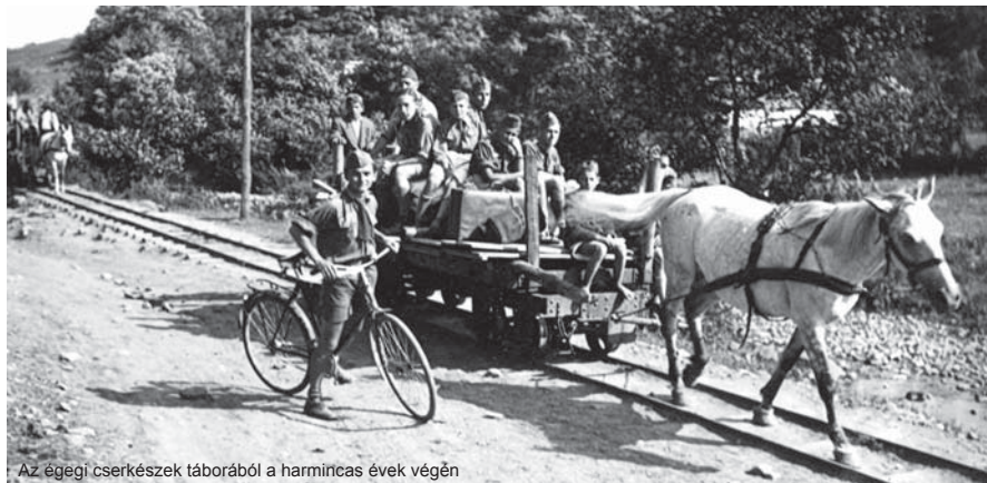
Az égegi cserkészek táborából a harmincas évek végén