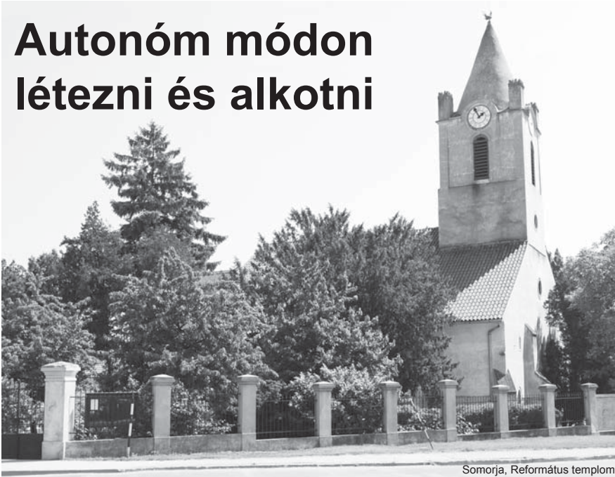
Somorja, Református templom

Somorját sokan a Csallóköz kapujának, mások végvárának nevezik. Utóbbi jelző a magyarság asszimilációjának kapcsán hangzik el gyakran, míg az első a főváros közelségére utal, amely molyként szippantja magába a környező településeket. Így Somorja kelet felé tényleg valamiféle kaput alkot. A város egykor betöltött szerepéből napjainkra jócskán vesztett, és tipikus kisvárosként, ha úgy tetszik, mezővárosként éli mindennapjait. A közel 13-ezer lakosú település – a város vezetése szerint – nem is igen akar ennél sokkal nagyobbra nőni. Már így is közel ezer bejelentetlen ember jár ide „meghálni”. Az ideális az lenne, ha Somorja lélekszáma nem lépné túl a tizenötezeret, és megmaradna a familiáris, „somorjás” jellege. A beköltözés és az évtizedeken keresztül ontott szívós állampropaganda eredményeként Somorja nemzetiségi összetétele már így is átlépte a rubikont: míg a 2001-es népszámláláskor a magyarok aránya 66 százalék volt a városban, mára a magyar őslakosok és a szlovákok aránya egyensúlyba került. A beköltözés ugyanakkor megtorpant, hiszen gépkocsival Pozsonyba beutazni és visszajutni felér egy kanosszajárással. Nem hiszem, hogy van az országban terheltebb főút, mint a 63-as, amelyen – s ezzel együtt a városon – naponta mintegy 80 000 gépjármű robog végig.