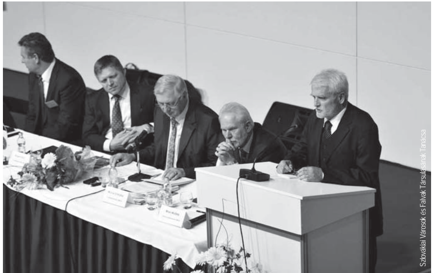
Szlovákiai Városok és Falvak Társulásának Tanácsa

nem hajtják végre a kormány takarékosági elvárásait, a jövő évben elvonja költségvetésükből azt az összeget, amellyel úgymond idén többet költenek. Kilátásba helyezte, hogy a 2000 lakosnál nagyobb települések esetében októbertől megkövetelik majd a részletes és folyamatos kimutatásokat költségvetésük alakulásáról, hogy az ország költségvetési hiányát megfelelő mederben tudják tartani. Jelezte: tárgyalni akar a szervezettel, hogy ezek a települések is ellenőrzés alatt tartsák költségvetésüket, s nem úgy nézzen ki, hogy a kormány ultimátumot ad vagy diktálni akar nekik. Egyértelművé tette azonban, hogy a kormány célkitűzéseiből nem enged.