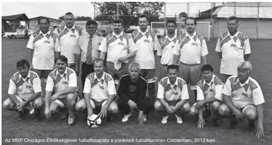
Az MKP Országos Elnökségének futballcsapata a pütkösi futballteránon Csicserben, 2012-ben