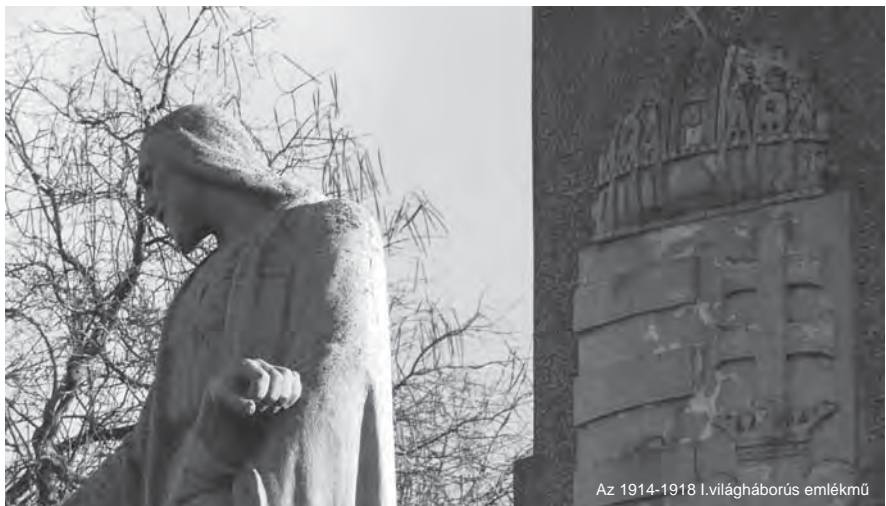
Az 1914-1918 I. világháborús emlékmű