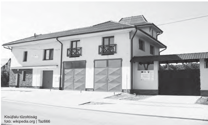
Kisújfalu tűzoltóság

ket, ezek különösen népszerűek és kedveltek a gyermekek körében. Ilyenkor távolabbi községekből is ellátogatnak a faluba, de gyakran mennek a helyi önkéntes tűzoltók is Bénybe, Fűrre vagy éppen a szomszédos Köbölkútra, ahol ugyancsak szerveznek versenyeket. A szervezet működéséhez szükséges pénzt kizárólag az önkormányzat biztosítja. „Kissé furcsa, ám igaz: az állam törvény erejével követeli meg, hogy minden egyes településen be legyen biztosítva a tűzvédelem, vagy hivatasos, vagy önkéntes tűzoltók által, ám ehhez – mint sok minden egyébhez sem – pénz, anyagi forrást nem ad.”