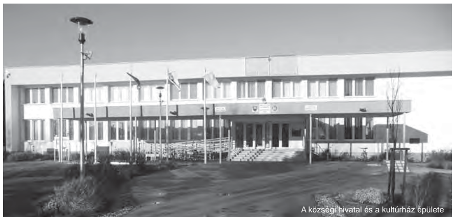
A községi hivatal és a kultúrház épülete

A kormány döntésével kapcsolatban a Népi Platform pártelnökei is nyilatkozatot adtak ki. A nyilatkozatot aláíró Bugár Béla (Most-Híd), Ján Figel' (KDH), Pavol Frešo (SDKÚ) pártelnökök szerint a Pered elnevezés ószláv eredetű, a Prěděslav rövidített megne-