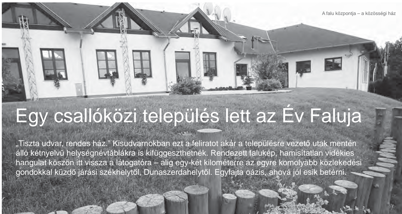
A falu központja – a közösségi ház