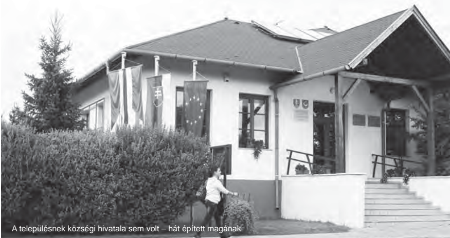
A településnek községi hivatala sem volt – hát épített magának