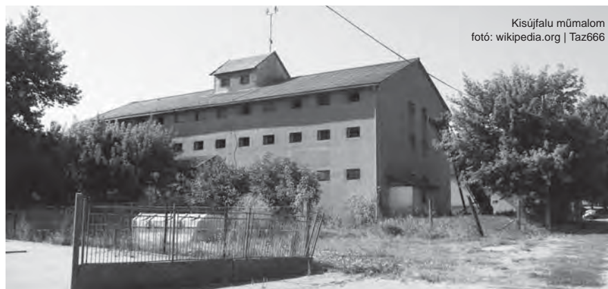
Kisújfalu műmalom

Viszonylag fiatalnak számít a helyi szervezetek közt az Úrbéres Társaság, amely 1994-ben alakult. Legfőbb céljuk a községi közös erdő tulajdonosainak az érdekképviselete. Mintegy 68 hektár erdőről van szó. A legutóbbi földtörvénnyel kapcsolatos változások