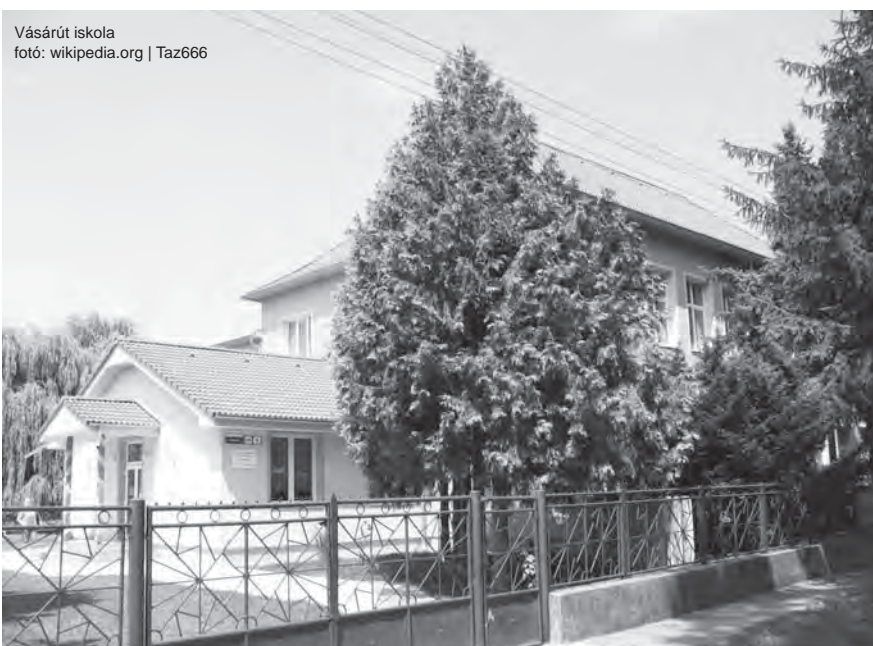
Vásárút iskola

Az iskola és az óvoda felújítása során elvégezték a hőszigetelést, a nyílászárókat újakra cserélték, s amellet, hogy minden osztályban fehér kerámiatáblát helyeztek el, két informatikai termet is kialakítottak. Természetes, hogy az iskolának jó a kapcsolata az önkormányzattal, rendezvényeiket támogatják, de maga az iskola is szokott pályázni. Legutóbb például az Ecopolis Alapítvány-