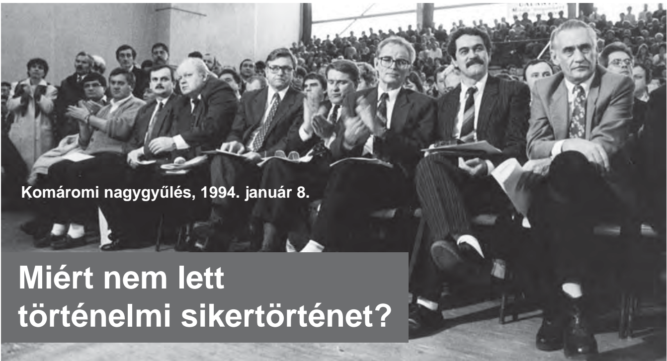
Komáromi nagygyűlés, 1994. január 8.