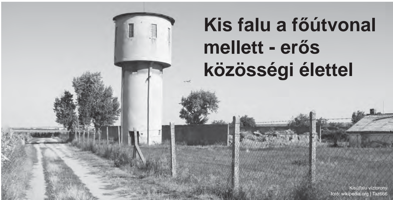
Kisújfalu víztorony