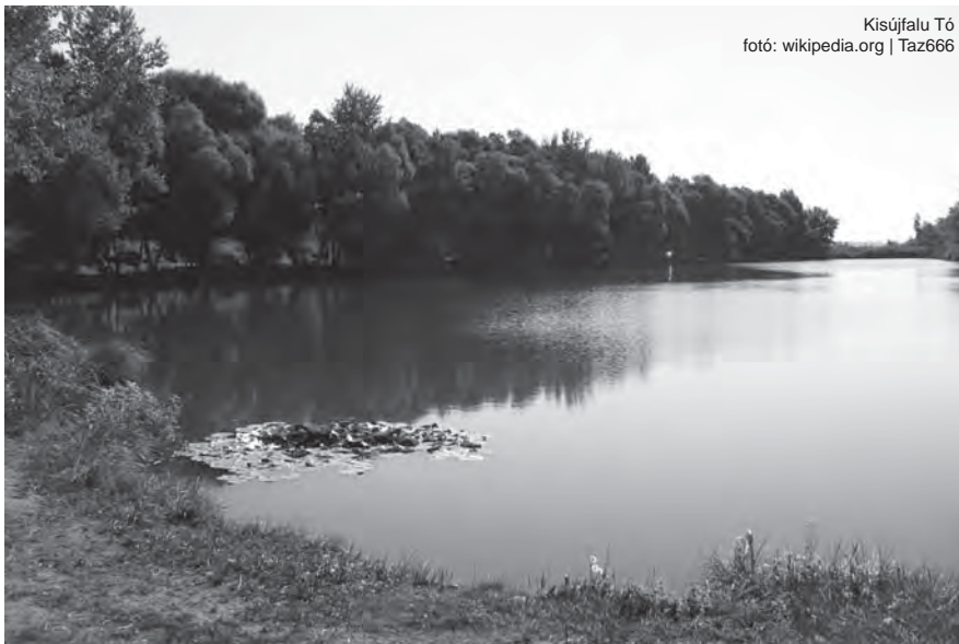
Kisújfalu Tó

Mindent megelőző cél, mert sok fejlesztési elképzelése van a falunak. Ilyen például egy hulladékgyűjtő udvar megépítése, amely a környezetvédelem mellett pár ember számára munkalehetőséget is nyújtana. Igen aktuális feladat az utak és a járdák felújítása, elsősorban Aradon és Réván. Ott ugyanis már az eredeti aszfaltozás sem volt megfelelő. A helyi óvoda és kisiskola hőszigetelését is tervezik, továbbá a nyílászárók cseréjét, s jó lenne az iskola épületének tetőszerkezetét úgy átépíteni, hogy a padlástérben edzőtermet lehessen kialakítani a fiatalok részére. A szép célok azonban betonfalnak ütköznek: „Az önkormányzatok alulfinanszírozása országosan közismert tény. Ez nálunk egyebek mellett azt is jelenti, hogy még a tervdokumentáció elkészítéséhez sincs pénz. Ha pedig mégis sikerülne kidolgozni, akkor két-három év leforgása alatt be kellene adni a pályázatot, mivel a tervdokumentáció egy bizonyos idő után elavul. Amennyiben viszont nincs megfelelő pályázati kiírás, akkor nincs hova beadni a tervet. A pályázatokkal az a jelenlegi helyzet, hogy mindig más a kiírások célja, mint amire konkrétan Kisújfalunak éppen szüksége volna. Az elektronikus ügyintézés beindítása példának okáért manapság nagyon népszerű uniós pályázati kiírás, vagy az önkormányzati lakások építésének támogatása, csakhogy a községnek másra lenne égetően szüksége” – válaszolja a „lehetetlen helyzetet” a falu első embere.