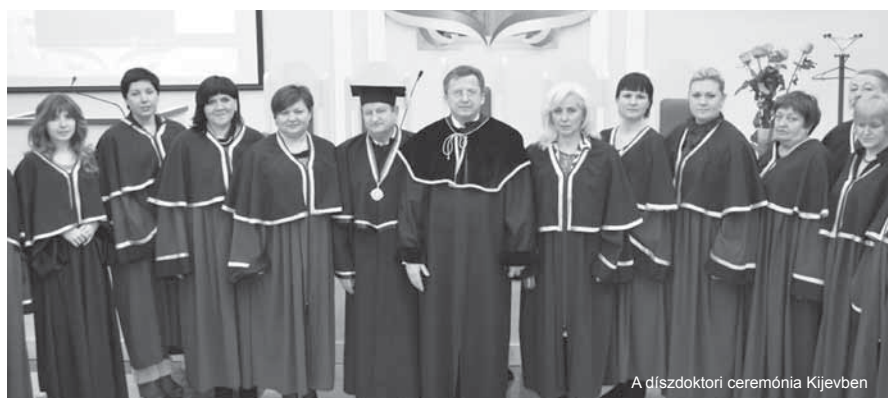
A díszdoktori ceremónia Kijevben