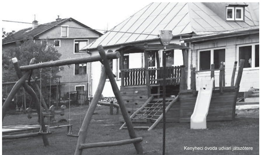
Kenyheci óvoda udvari játszótéren