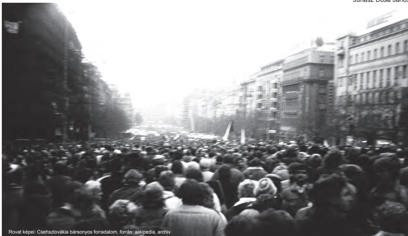
Rovat képei: Csehszlovákia bársonyos forradalom, forrás: wikipedia, archiv