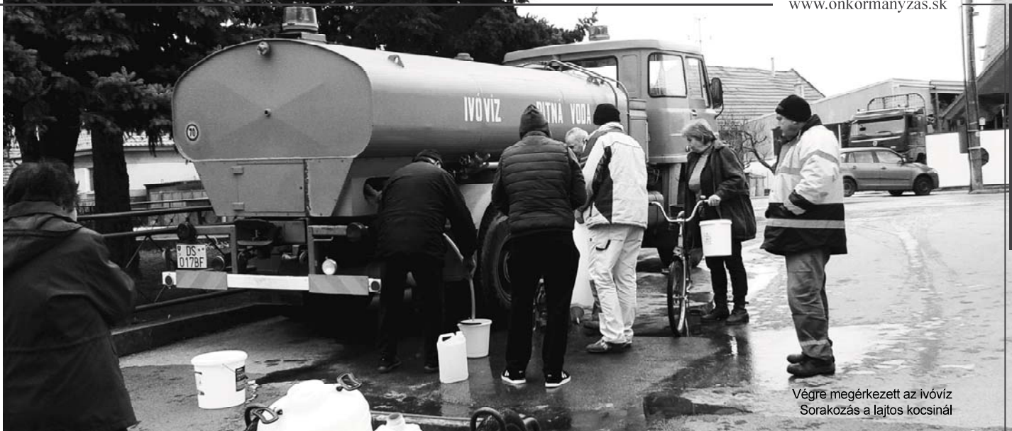
Végre megérkezett az ivóvíz Sorakozás a lajtos kocsinál