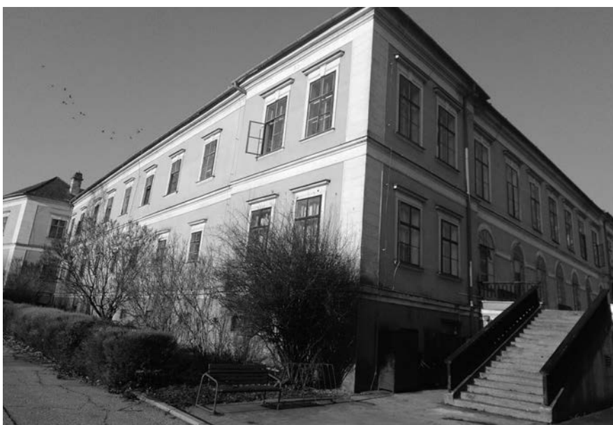
Egy szoba a jó karban lévőknek | Teraszos kastélyrészlet

A bósi idősotthonnak jelenleg 50 alkalmazottja van és nemcsak az ápolók és nővérek tartoznak bele, hanem a konyha, a mosoda munkatársai, valamint a takarítók és adminisztratív munkások is. Az ápolók és nővérek kiválasztásánál különösen körültekintőnek kell lenni, hiszen akiben nincs kellő empátia, az nem alkalmas arra, hogy itt dolgozzon. Nehéz munka ez abból a szempontból is, hogy itt a nap huszonnégy órájában dolgozni kell, éjszakai ügyelet is van. Ráadásul a fizetések sem magasak, sokkal többet érdemelnének azok, akik a lakók napi ellátásában részt vesznek.