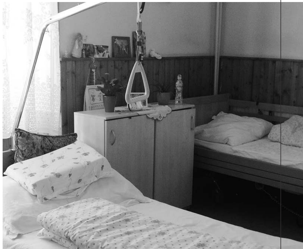
A mozgáskorlátozottak emelős ágyakon fekszenek

Az itt lévő idősek számára a legnagyobb öröm, ha hozzátartozók érkeznek. Sajnos, kevesüket látogatják rendszeresen, és alig akad köztük néhány, akit nagy ünnepkor, például karácsonyra hazavisznek. Természetesen ritka kivételek itt is akadnak, volt például egy hölgy, aki – éveken keresztül – minden második hétvégére hazavitte az édesanyját. Tőle szép köszönőlevelet és apró ajándékot is kaptak az otthon dolgozó – emberséges bánásmódjukért.