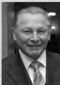
Obr. 6 Rudolf Schuster (1934)

Prezident Slovenskej republiky. Vyrastal v Medzeve (nemecky Metzzenstein) neďaleko Košíc. Niekoľko rokov bol primátorom Košíc, po každej revolúcii (1989) bol predsedom Slovenskej národnej rady. V roku 1999 sa stal druhým prezidentom Slovenskej republiky. Túto funkciu vykonával do roku 2004. Rudolf Schuster je známy aj ako spisovateľ, v posledných rokoch však