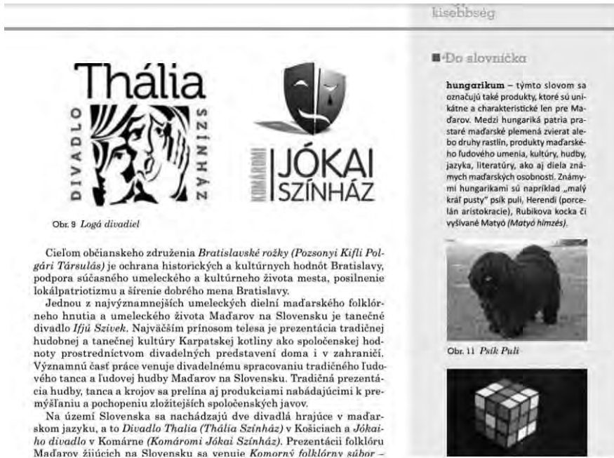
Obr. 9 Logó divadiel

Cielom občianskeho združenia Bratislavské rožky (Pozsonyi Kifli Polgári Társulás) je ochrana historických a kultúrnych hodnôt Bratislavy, podpora súčasného umeleckého a kultúrneho života mesta, posilnenie lokálpatriotizmu a šírenie dobrého mena Bratislavy.