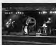
Obr. 8 Ghymes

Spisovateľ a publicista, vysokoškolský pedagóg, významný predstaviteľ maďarskej literatúry na Slovensku. Je nositeľom viacerých ocenení za literárnu prácu, medzi inými je to Cena Imre Madácha, Cena Józsefa Attila a Kossuthova cena.