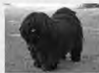
Obr. 11 Pstik Pulí

hungarikum – týmto slovom sa označujú také produkty, ktoré sú unikátne a charakteristické len pre Maďarov. Medzi hungariká patria prastaré maďarské plemená zvierat alebo druhy rastlín, produkty maďarského ľudového umenia, kultúry, hudby, jazyka, literatúry, ako aj diela známych maďarských osobností. Známymi hungarikami sú napríklad „malý kráľ pustý“ psík puli, Herendi (porcelán aristokracie), Rubikova kocka či vyšívané Matyó ( Matyó hímzés ).