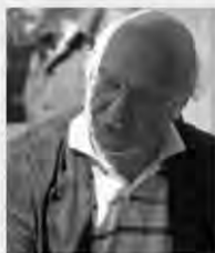
Obr. 7 Lajos Grendel (1948 – 2018)

Spisovateľ a publicista, vysokoškolský pedagóg, významný predstaviteľ maďarskej literatúry na Slovensku. Je nositeľom viacerých ocenení za literárnu prácu, medzi inými je to Cena Imre Madácha, Cena Józsefa Attila a Kossuthova cena.